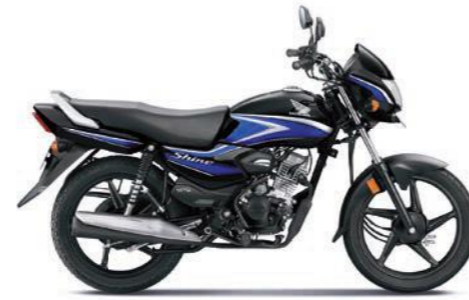
ब्लू के साथ ब्लैक