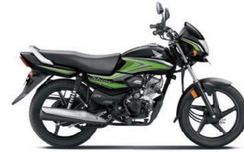
ग्रीन के साथ ब्लैक