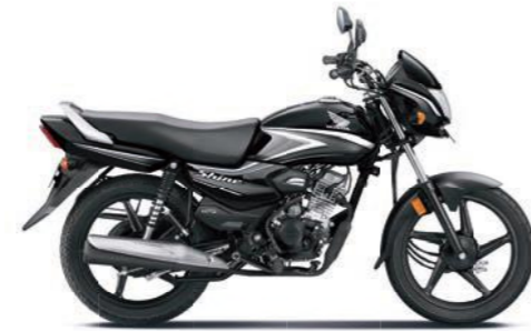
ग्रे के साथ ब्लैक

अभी ऑनलाइन बुक करें! www.honda2wheelerindia.com