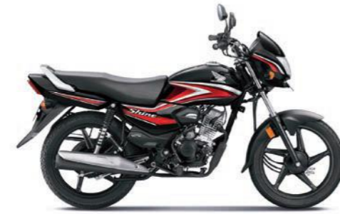
रेड के साथ ब्लैक