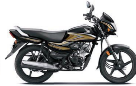
गोल्ड के साथ ब्लैक